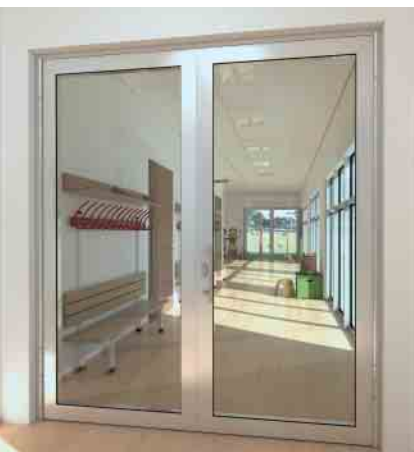
Klemmfreie Tür Anti-finger-trap door

The door and wall construction for multi-purpose applications. The series has been tested in accordance with European standards (EN 1364/1634) and German standards (DIN 4102) and meets the requirements of fire protection classes EI30 (T/F30) and EW30 (G30)