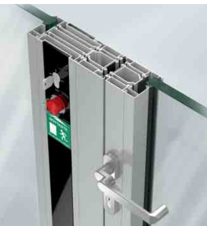
Schüco Door Control System (DCS) Schüco Door Control System (DCS)

The series is based on stable, 5-chamber hollow profiles with a basic depth of 80 mm with which clear opening dimensions of up to 1400 mm x 2988 mm can be constructed. Optional fittings components can be added to create tailored, multi-purpose doors to meet the widest range of requirements for building security and automation. In addition to fire and smoke protection properties, this series features other application options. These include, for example, burglar resistance to RC 3 (WK3), a combination of burglar resistance to RC 2 (WK2) and a panic function, sound reduction (42 dB) and the safety barrier with building authority approval for fixed glazing. Mechanical durability test certificates in accordance with EN 12400, class 8, are also available. It was possible to obtain the certificate for doors with 1 million cycles using this stable system. Furthermore, tests for protection against vandalism in accordance with EN 1192, class 4, were also passed. Class 4 is the highest protection against vandalism and excessive use of force. The use of central glazing or angled glazing beads provides the user with numerous design options. Concealed top door closers, pre-selectors or door hinges can also be used. Features of the fixed glazing include floor-to-ceiling height and a design with vertical silicone joints. Another option is the use of an opposed opening door. Whether in a newbuild or a renovation project, these opening types ensure smooth functioning for day-to-day operation.