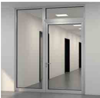
Rahmenbauweise Frame construction method

Schüco has developed a new, simple solution for the use of concealed fittings based on innovative open rebate profile geometry and tailored to the requirements of efficient fabrication. This means that the complicated machining which was previously required is no longer necessary. Thanks to the open rebate profile geometry, a straightforward cable guide for electrical door components is easy to implement – even for retrofitting in the installed unit.