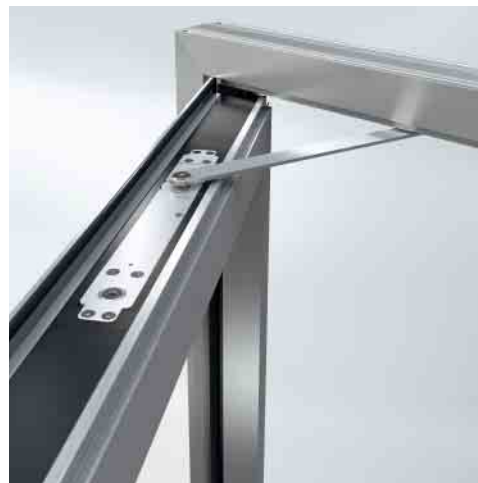
Verdeckt liegender Türschließer – keine Unterbrechung der klaren Linienführung Concealed door closer – clean lines of design not interrupted