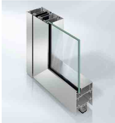
Schüco Tür FireStop ADS 76.NI SP Schüco Door FireStop ADS 76.NI SP