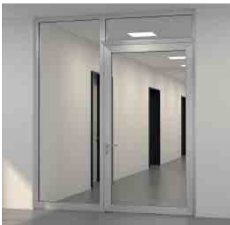
T-Verbinder Bauweise T-cleat construction method

The new simplicity in fabrication and installation is enabled thanks to innovative profile geometry and new fittings range