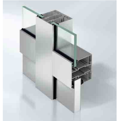
Schüco FireStop ADS 76.NI als Festverglasung für Rauchschutz Schüco FireStop ADS 76.NI as fixed glazing for smoke protection

Mit der FireStop Rauchschutztürkonstruktion werden die gleichen lichten Durchgangsmaße von maximal 1.500 x 3.100 mm für einflügelige Türen sowie 3.055 x 3.100 mm für zweiflügelige Türen realisiert wie mit der Brandschutztür Schüco FireStop ADS 90 FR 30. Auch Türen mit Oberlichtern und Seitenteilen können in derselben Art mit ein- und zweiflügeligen Varianten umgesetzt werden.